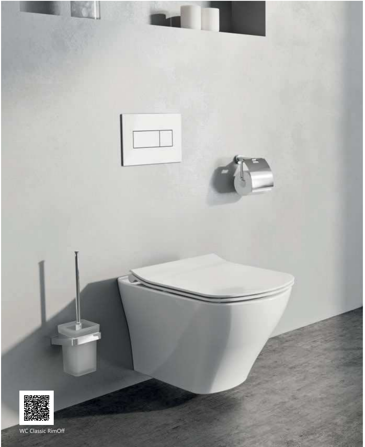
WC Classic RimOff

KONCEPCIÓ Classic koncepció Lapozzon a 34. oldalra!