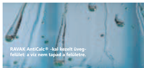
RAVAK AntiCalc® -kal kezelt üveg- felület: a víz nem tapad a felületre.

Az esővíz és a desztillált víz kivételével minden vízben található bizonyos mennyiségű ásvány. Az ásványok üledéke a vízkő csak nagy nehézségek árán távolítható el. Az üveggel kémiai kötést alakít ki és idővel csúnyán elszínezi azt. A hagyományos vegyi tisztítószerek teljes mértékben hatástalanok a vízkővel szemben. A szennyeződések tartós lerakódását kizárólag az üveg felületét kezelő RAVAK AntiCalc® szabadalmazott technológia képes megbízhatóan meggátolni, az összes üvegbetétes RAVAK zuhanykabint és kádparavánt már gyártás közben elláttuk ezzel a védőréteggel.