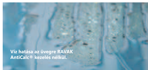
Víz hatása az üvegre RAVAK AntiCalc® kezelés nélkül.